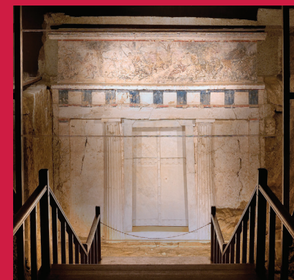
ΤΥΜΒΟΣ ΦΙΛΙΠΠΟΥ Β' TOMB OF PHILIP II