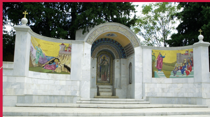
ΒΗΜΑ ΑΠΟΣΤΟΛΟΥ ΠΑΥΛΟΥ APOSTLE PAUL TRIBUNE