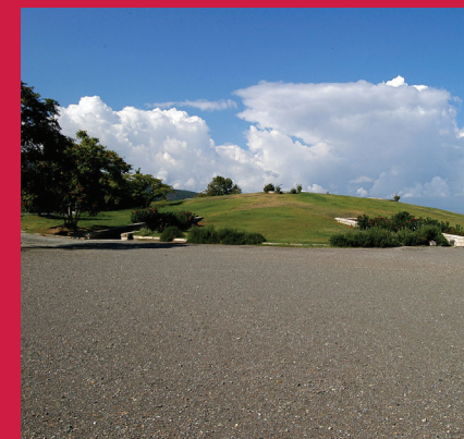
ΜΟΥΣΕΙΟ ΒΑΣΙΛΙΚΩΝ ΤΑΦΩΝ ΑΙΓΩΝ THE MUSEUM OF THE ROYAL TOMBS