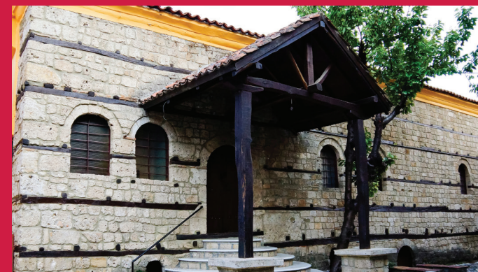
ΕΒΡΑΪΚΗ ΣΥΝΑΓΩΓΗ JEWISH SYNAGOGUE