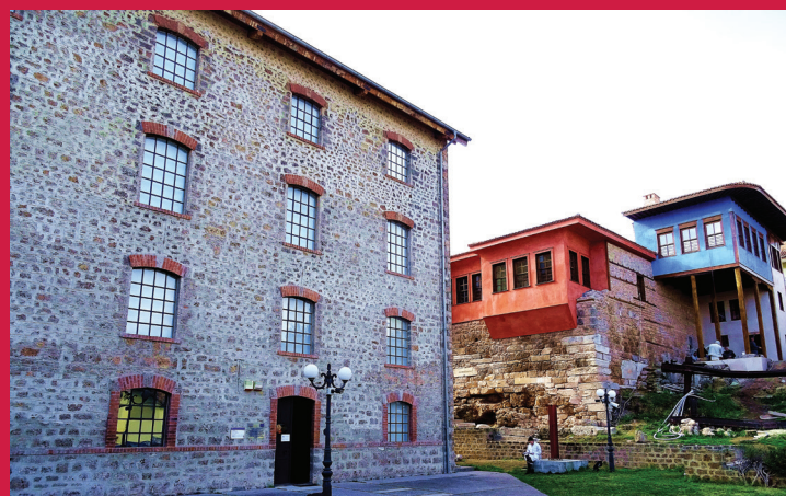
ΒΥΖΑΝΤΙΝΟ ΜΟΥΣΕΙΟ BYZANTINE MUSEUM