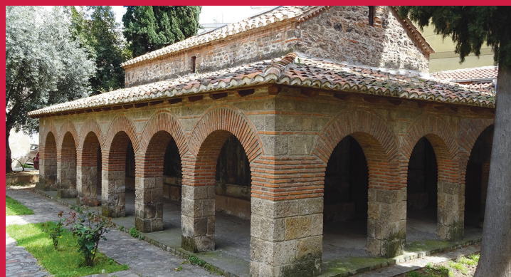
ΕΚΚΛΗΣΙΑ ΤΟΥ ΧΡΙΣΤΟΥ JESUS CHRIST CHURCH